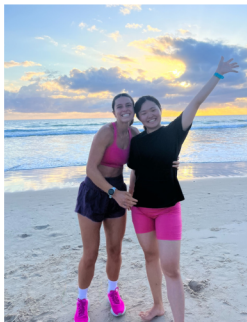
インフルエンサーと