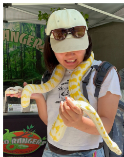
大学にヘビが来た